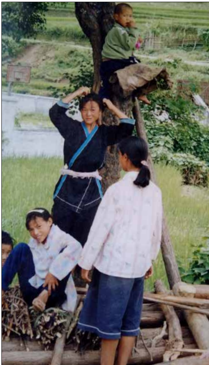
Vähemmistökansojen äitiä ja lapsia odottamassa bussia vuoristokylässä.

Kirkon ja myöhemmin yhteiskunnan sosiaalitoimen kanssa järjestettiin ns. nuorisokeskuk-