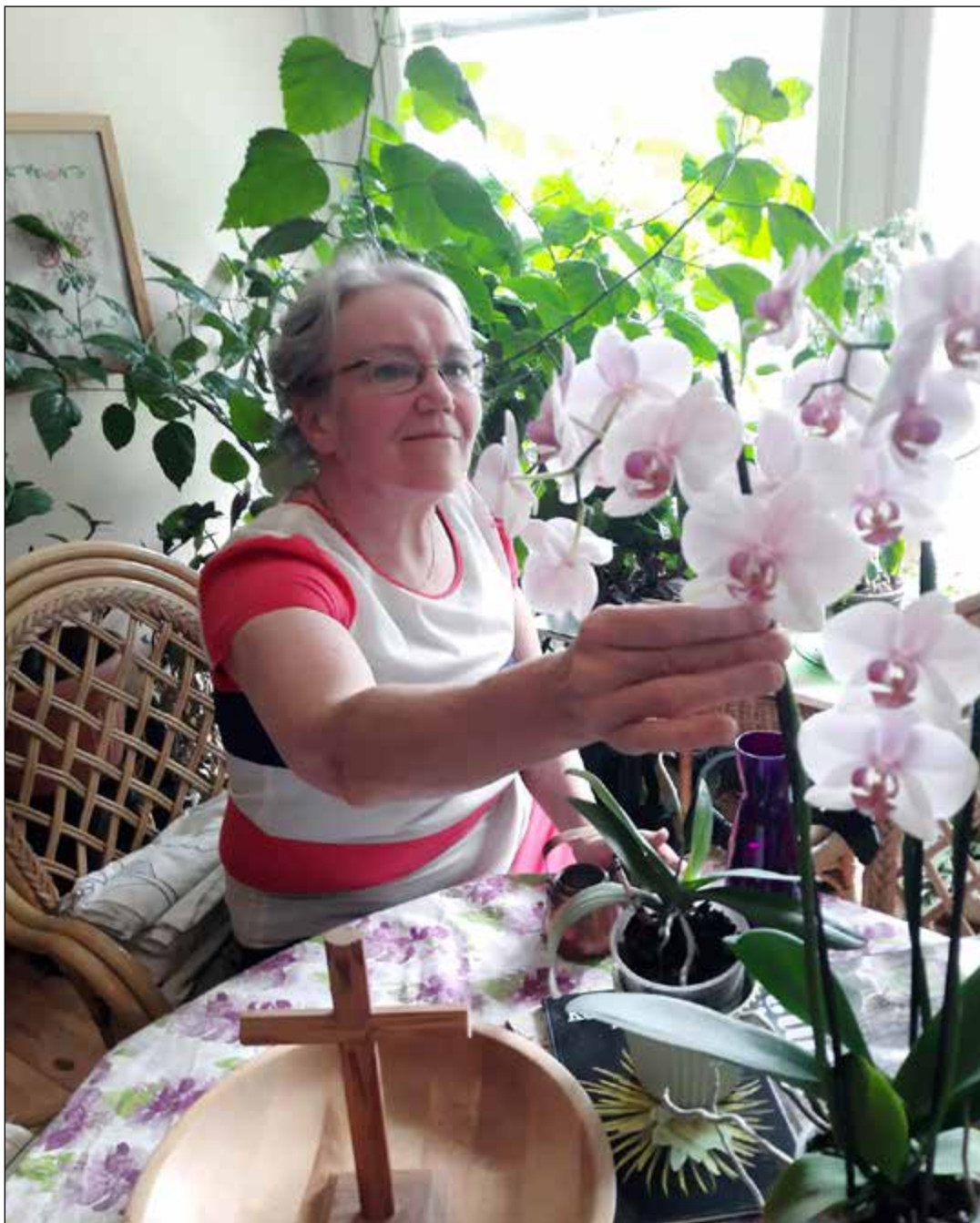
Kotiin tultua katselen vihreää kasvua, muistan kukkien lahjoittajia ja kasvatan hieman syötäväkin, tomaatteja ja perunoita.

Urkureita kohtaan koen ihailua, sillä urkuri kuulosti nuorena hienolta, mutta soittotaitoa olisi pitänyt olla. Esinesuunnittelijan alaa Kuopion muotoiluakatemiassa harkitsin, mutta ahaa-elämys teologiasta syntyi,