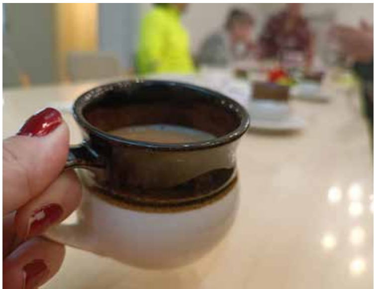
Diakonian aamupäivissä voi jutella tuttaviensa kanssa kahvikupin äärellä.