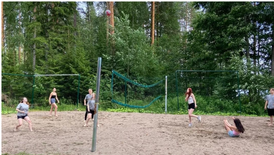
KUVA 20 KESÄN RIPAREILLA PUURTILAN LENTOPALLOKENTTÄ OLII KOVALLA KÄYTÖLLÄ.