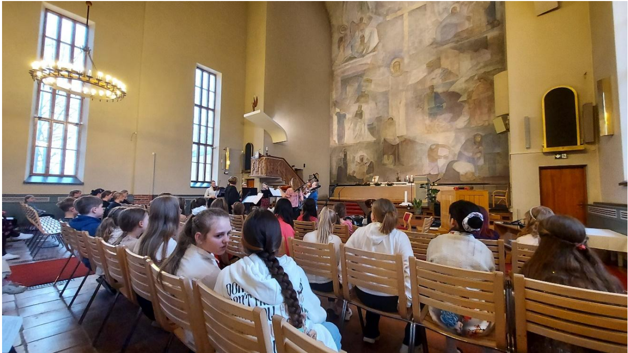
KUVA 9 PERINTEINEN LASTEN JA NUORTEN YHTEISVASTUUKONSERTTI YHDESSÄ WALTTERIN KOULUN MUSIIKKILUOKKIEN JA SOISALO-MUSIIKKIOPISTON KANSSA KOKOSI HUHTIKUUSSA KIRKKOON ENNÄTYKSELLISESTI YLI 60 ESIINTYJÄÄ. HEITÄ SAAPUI KUULEMAAN SUURI JOUKKO MUSIIKIN YSTÄVIÄ.