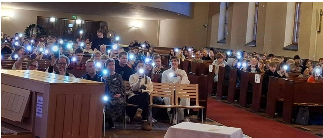
KUVA 26 KUOPION HIIPPAKUNNAN NUORISOTAPAHTUMA VALOVOIMAINEN LOKAKUISSA OLI SUURI VOIMAIN PORNISTUS KASVATUSTYÖN VÄELTÄ.