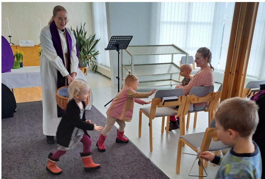
KUVA 7 LASTEN PÄÄSIÄISKIRKKO VIETETTIIN HILJAISILLA VIIKOLLA MYÖS LUTTILAN KAPPELISSA.

Talousarviovuodelta 2024 laadittiin toiminnasta talouden osavuosisikatsaukset 31.3. ja 1.7., jotka kirkkoneuvosto käsitteli kokouksissaan.