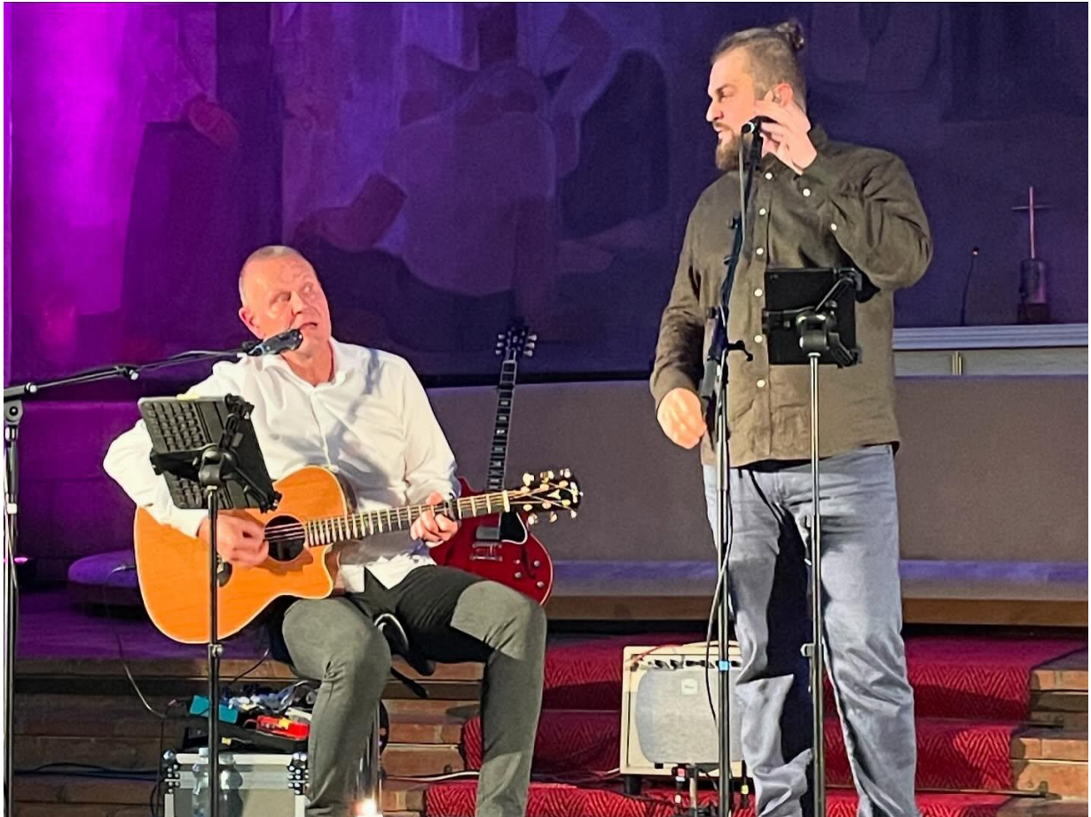
KUVA 22 SYYSKUUSSA VARKAUSPÄIVIEN YHTEYDESSÄ PÄÄKIRKOSSA OLI ESIINTYMÄSSÄ DUO HETKI.

Kirkkoneuvosto esittää kirkkovaltuustolle, että vuoden 2024 ylijäämä 65 927,01 euroa kirjataan taseen tilille tilikauden yli-/alijäämä.