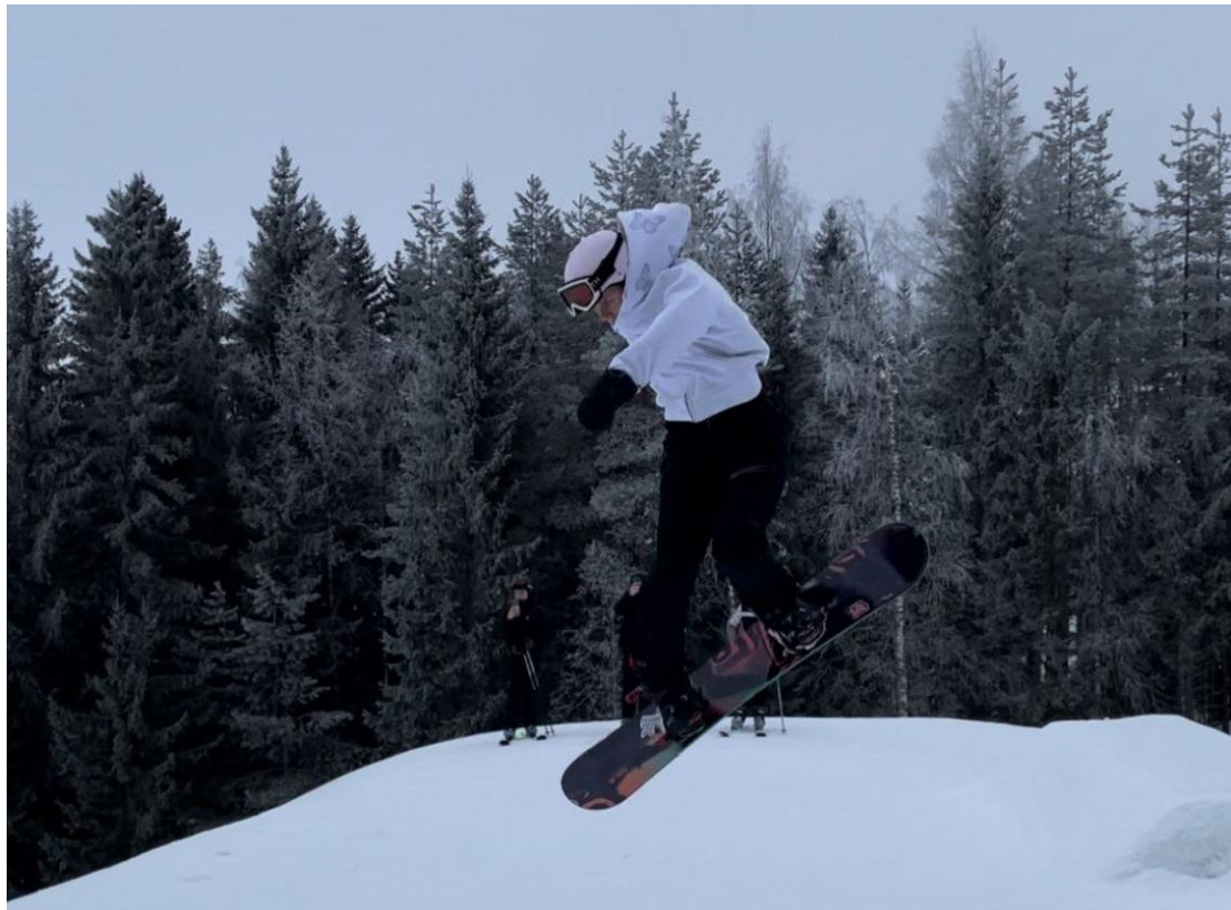
KUVA 5 HIIHTOLOMARIPARIN HARRASTEPÄIVÄ SUUNTAUTUI KASURILAAKSEEN LASKETTELEMAAN. KUVA: RIPPILEIRIN ISOSET.