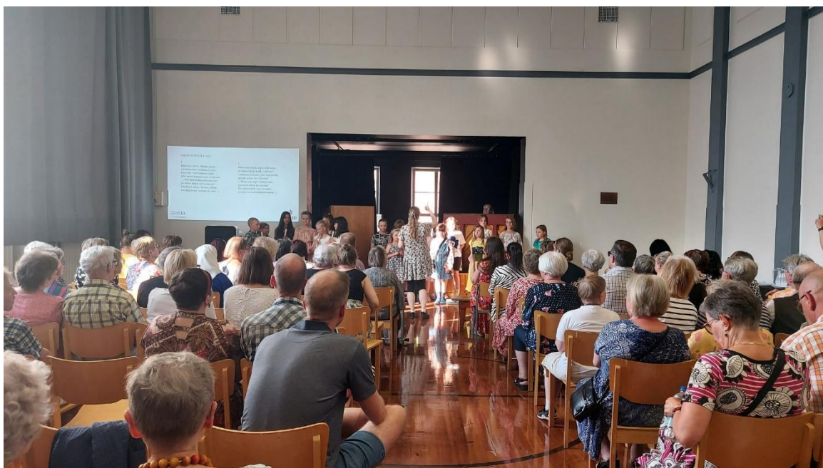
KUVA 17 MUSEOKESKUS KONSTISSA LAULETTIIN KESÄN KORVALLA KOULULAULUJA.