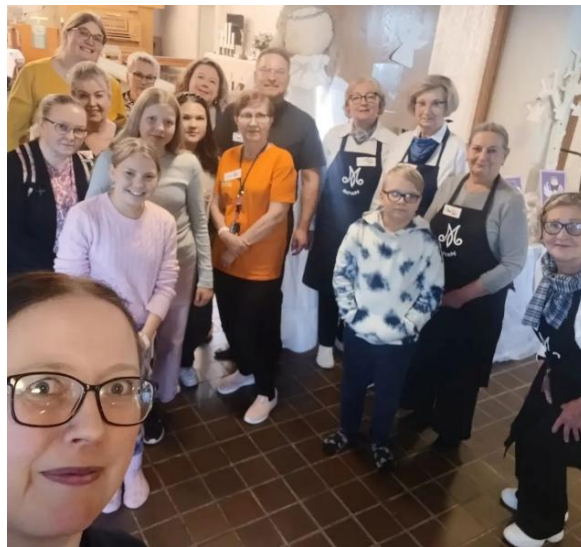
KUVA 25 MIKKELINPÄIVÄNÄ VIETETTIIN SUUREN VAPAAEHTOISJOUKON AVUSTUKSELLA VARKAUDEN SEURAKUNNAN ENSIMMÄISTÄ MESSY CHURCHIA.