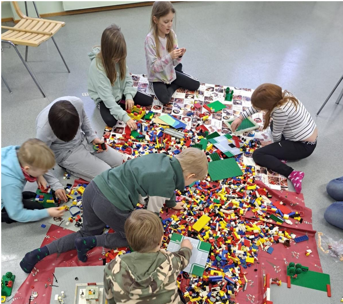
KUVA 1 VARHAISKASVATUKSEN KERHOT KÄYNNISTYIVÄT HETI VUODEN VAIHTEEN JÄLKEEN. OSALLISTUJIA RIITTI VUONNA 2024 RUNSAASTI.