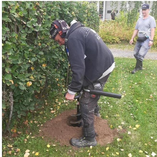
KUVA 24 SYKSYLLÄ HAUTAUSMAILLA ILOITTIIN UUDESTA MAAPORASTA.

Asunto-osakkeet ovat taseessa hankinta- arvossaan. Sijoitus- ja vuokratoiminnan nettotuotoiksi saatiin yhteensä noin 104 500 euroa. Sijoitetun pääoman tuotto oli taseen vastattavaa ryhmän pääoman 1.1.2024 arvosta 3 174 703 laskien noin 3,3 prosenttia. Sijoitustoiminnan tuotto oli siten yleiseen korkotasoon nähden edelleen heikko, ja heikentyi 0,01 prosenttiyksikköä edelliseen vuoteen 2023 verrattuna.