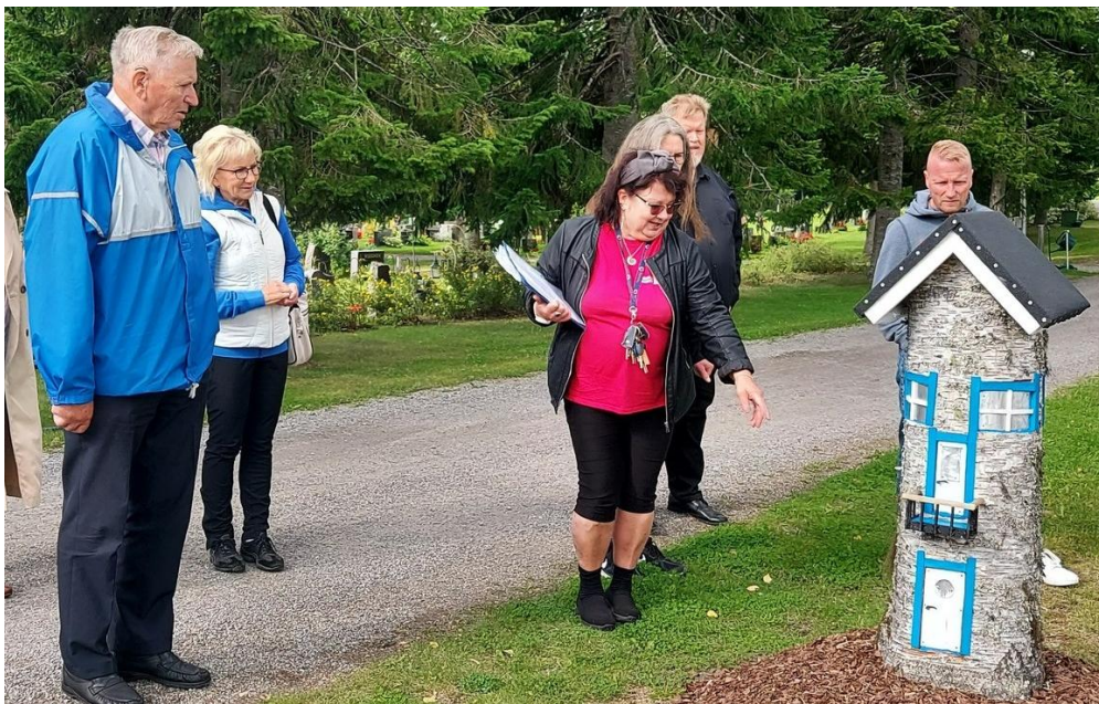
KUVA 23 HAUTAUSMAAKATSELMUKSESSA ELOKUUSSA IHAILTIIN LUTTILAN HAUTAUSMAAN KANNOISTA TEHTYJÄ MÖKKEJÄ.

Seurakunnan henkilöstön lakisääteisten vakuutusten lisäksi seurakunta on ottanut toiminnalleen vastuuvakuutuksen, ja kaikki ikäryhmät kattavan ryhmätapaturmavakuutuksen leiri-, retki- ja kerhotoimintaa varten. Tapaturmavakuutus kattaa myös luottamushenkilöiden kokousmatkat. Seurakunnan omistamilla kiinteistöillä on kohteen mukaan joko täysarvo- tai vakuutusmääräpohjainen vakuutus ja kiinteistöturvan vastuuvakuutus. Metsävakuutukset ovat ainaismetsävakuutuksia. Hautatoimen kaivinkoneella, traktorilla ja pienetraktorilla on sekä liikennevakuutus että vapaaehtoinen autovakuutus. Seurakunnan käyttämä vakuutusyhtiö on Pohjola Vakuutus.