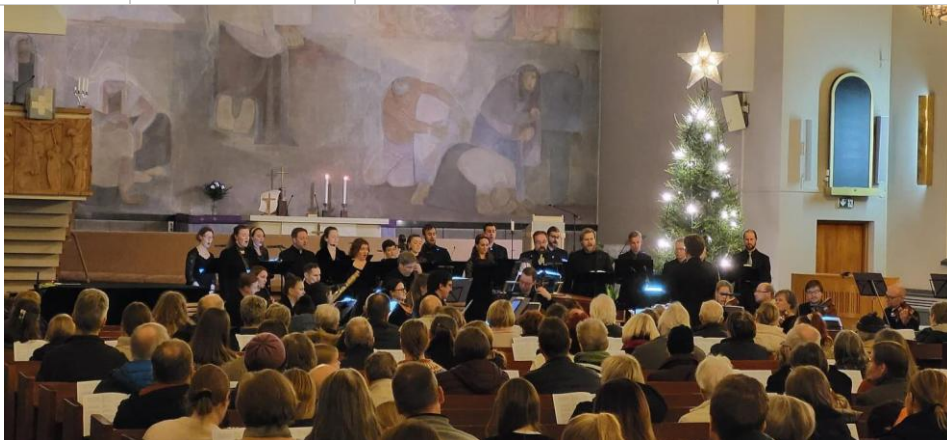
KUVA 27 HÄNDELIN MESSIAS ORATORIO JOULUKUUSSA VARKAUDEN PÄÄKIRKOSSA OLI UNOHTUMATON ELÄMYS.