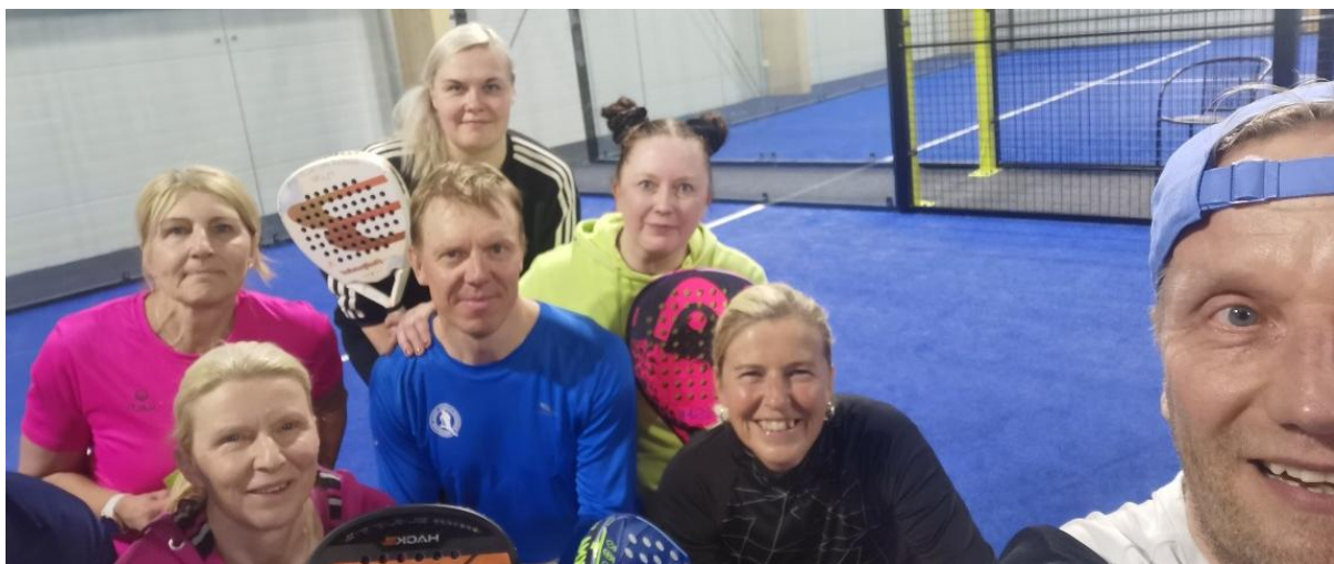
KUVA 14 MAAILMAN HISTORIAN ENSIMMÄINEN YHTEISVASTUU PADEL AMERICANO TURNAUS PELATTIIN UNELMIEN LIIKUNTAPÄIVÄNÄ TOUKOKUUSSA.