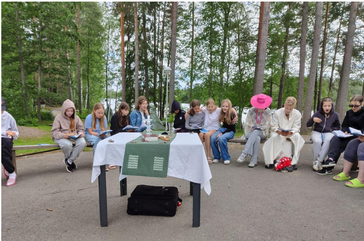
KUVA 19 KESÄN KOULULAISTEN LEIREILLÄ PÄÄSTIIN MYÖS HARTAUDEN HARJOITUKSEEN LUONNON HELMASSA.