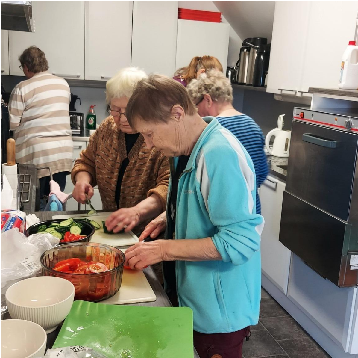
KUVA 11 VILJOLAHDEN TOUKOLASSA KOKOONNUTTIIN PITKIN VUOTTA YHDESSÄ OLON MERKEISSÄ. OSALLISTUJIA OLI JOKA KERTA LÄHES 20!