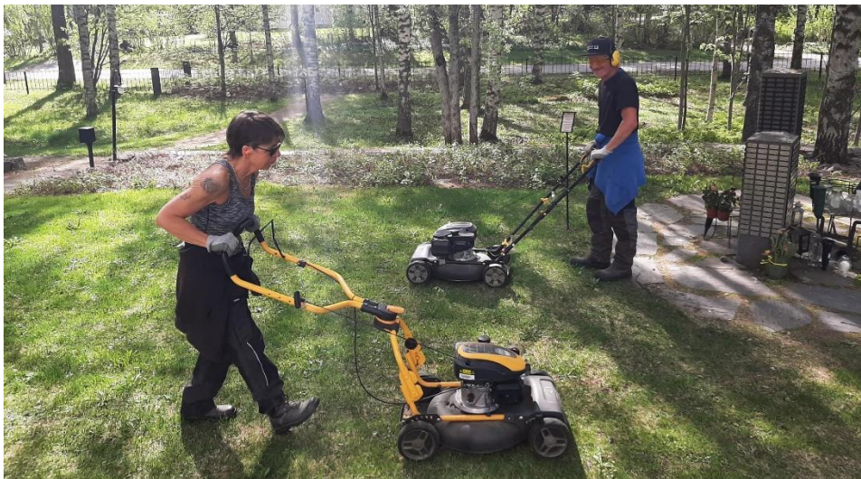
KUVA 16 HAUTAUSMAILLA HUHKITTIIN KESÄLLÄ MYÖS AURINGON PAISTEESTA.