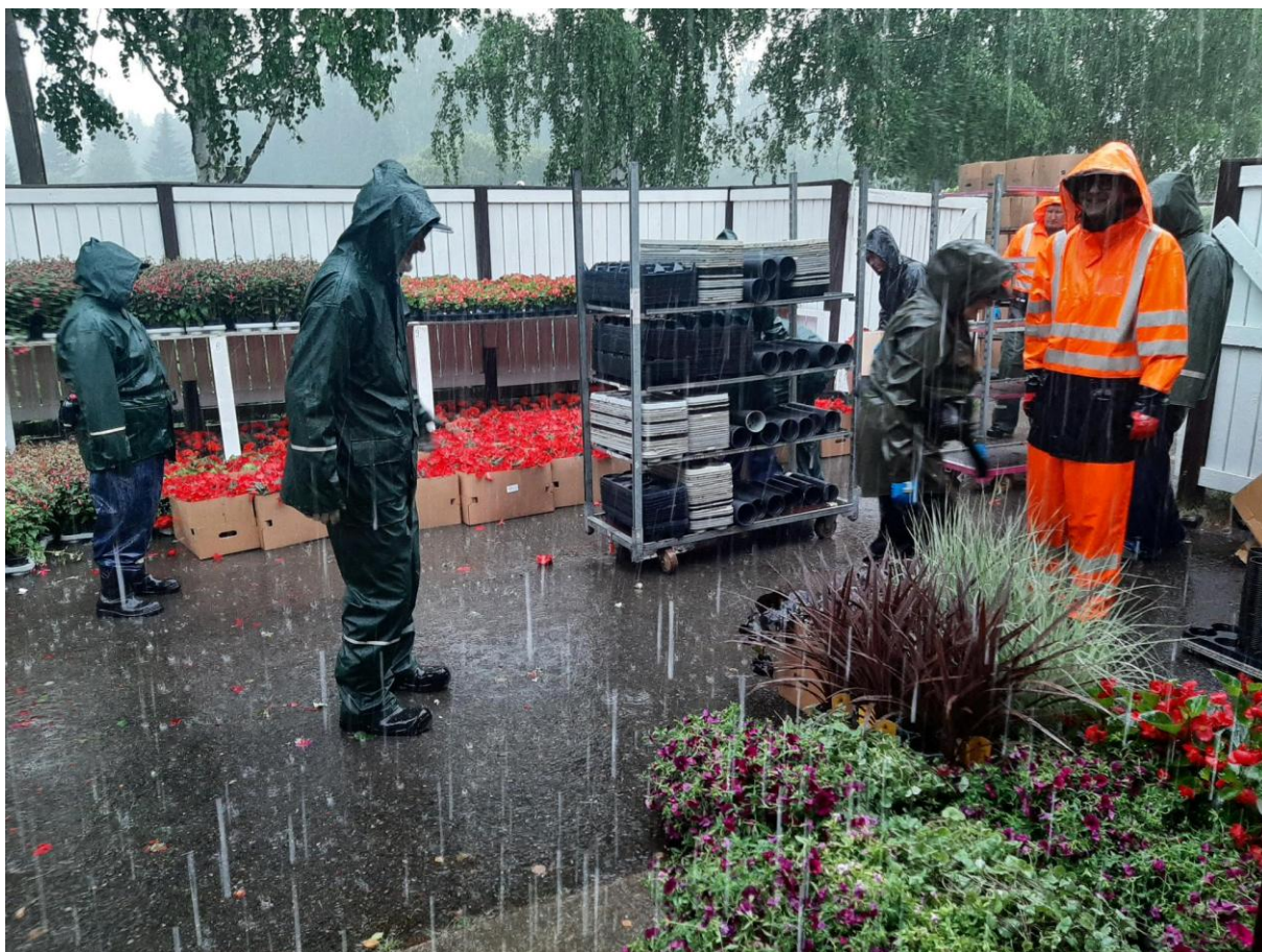
KUVA 18 HAUTAUSMAILLA PÄÄSTIIN TYÖSKENTELEMÄÄN MYÖS VESISATEESSA.