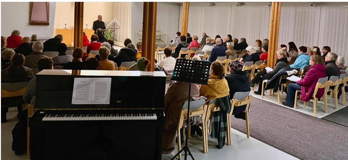
KUVA 28 KAUNEIMMAT JOULULAULUT VETIVÄT ENNÄTYSMÄÄRÄN OSALLISTUJIA KAIKISSA TILAISUUKSISSAAN. KUVA: HILDA SUNI.

Kirjanpidot, tililuettelo sekä luettelo kirjanpidoista ja aineistoista säilytetään vähintään 10 vuotta tilikauden päättymisestä (KPL 2:10.1 §), mikäli EU-säädökset eivät vaadi pidempää säilytysaikaa. Kiinteistöinvestointeihin liittyvät laskut, tositteet ja muut selvitykset säilytetään 13 vuotta sen kalenterivuoden päättymisestä, jolloin kiinteistöinvestointi on valmistunut. Kirjanpito- ja tilinpäätösaineisto säilytetään koneellisella tietovälineellä. Kirjanpitoaineisto on tallennettava kahdelle eri tietovälineelle. Kirkon palvelukeskuksen järjestelmissä oleva aineisto on säilytettynä järjestelmässä ja erillisinä varmuuskopioina.