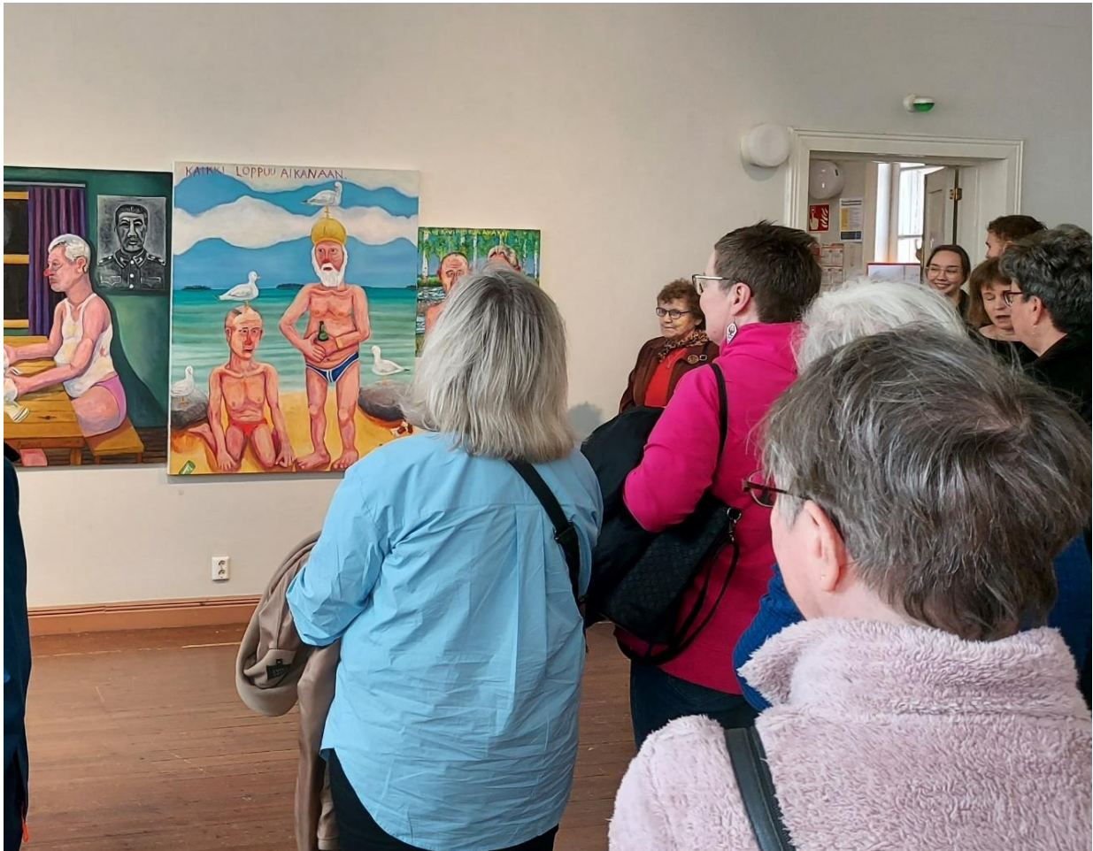
KUVA 12 TOUKOKUUSSA PERINTEINEN VAPAAEHTOISTEN KIITOSRETKI SUUNTAUTUI JOENSUUHUN TAIDEKESKUS AHJOON.