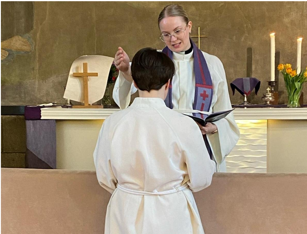
KUVA 6 PALMUSUNNUNTAINA VIETETTIIN TUPLAJUHLAA, KUN VIETETTIIN MYÖS AIKUISEN KONFIRMAATIOTA.